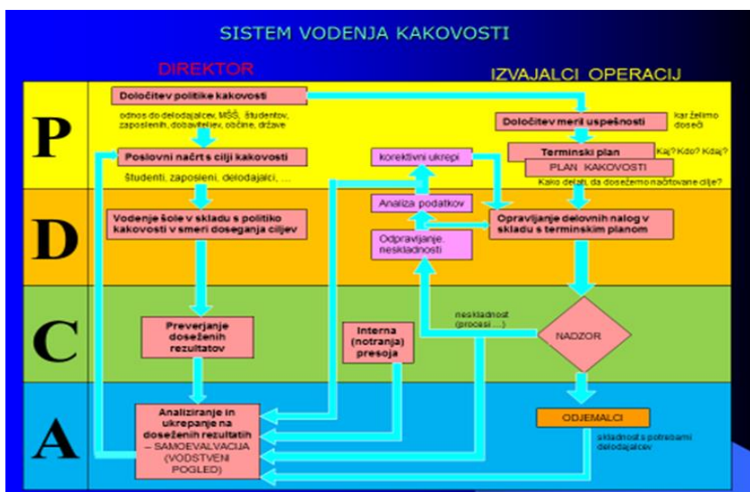
Slika 1: Sistem vodenja kakovosti

V visokem šolstvu bi lahko delovanje po naslednjih skicah (predlog, ideja - nastalo v okviru višjih strokovnih šol):