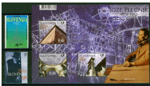
Slika 3: Na sliki je na levi strani prva znamka izdana na dan proglasitve samostojnosti Slovenije in znamka s Plečnikovo podobo, na desni pa je blok s portretom Plečnika, zemljevidom Ljubljane s tremi znamkami, ki prikazujejo detajle Narodne in univerzitetne knjižnice, Žal ter cerkve na Barju

Dr. Friderik Pregl (1869-1930) se je rodil v Ljubljani kjer je tudi končal gimnazijo. Študiral je medicino v Gradcu in bil 1894 promoviran za doktorja vsega zdravilstva. Ob medicinski izobrazbi je preučeval tudi kemijo. Po končanem študiju se je izpopolnjeval na različnih univerzah in inštitutih po Evropi. S pomočjo podjetja Kuhlmann iz Hamburga, ki je v tistem času izdelovalo tehtnice z največjo natančnostjo, je Pregl dosegel, da je njegova tehtnica tehtala na milijoninko grama natančno. Tako je lahko razvil metodologijo, ki je spremenila dotedanjo kvantitativno organsko mikroanalizo. Za svoje delo je kot edini Slovenec prejel leta 1923 Nobelovo nagrado. Avstrijska pošta je ob 50 letnici podelitve te nagrade izdala znamko z likom Friderika Pregla. Prav tako je izdal znamko z njegovim likom Sveti Vincent in Grenadini ter blok z eno znamko Demokratična republika Kongo.