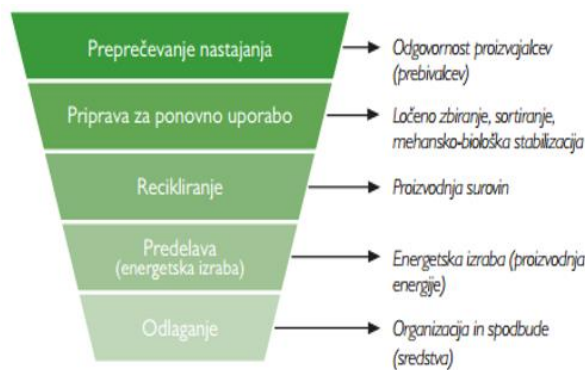
Slika 1. Hierhija ravnanja z odpadki.

Če Slovenijo primerjamo z drugimi članicami Evropske unije, daleč najbolj zaostajamo v četrtem segmentu, to je energetska izraba odpadkov.