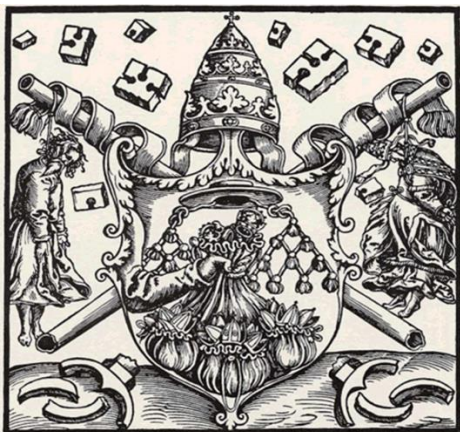
Slika 1. Satira papeškega grba, 1524, lesorez.

effigie , da bi na takšen način kaznovali papeža in katoliške dostojanstvenike ter s tem pokazali na njihovo pravo, zločinsko in izdajalsko naravo.