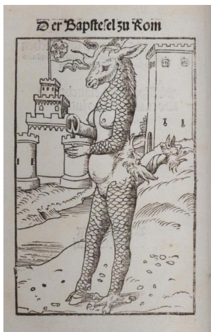
Slika 2. Lucas Cranach Starejši, Papeški osel , 1523, lesorez.

Osmo poglavje ima naslov Papeški osel in meniško tele . Naslovnica Luthrovega dela Zoper papeštvo v Rimu, katero je hudič ustanovil je krasila podoba Papeškega osla ( Papstesel ). V bistvu je v tem primeru šlo za ponatis podobe, ki je bila natisnjena skupaj z drugo pošastjo, imenovano Meniško tele ( Mönchscalb ). Obe pošasti sta bili natisnjeni že leta 1523 v pamfletu, ki sta ga napisala Philip Melanchthon in Martin Luther. Ti podobi sta za vizualno kulturo nemške reformacije izjemnega pomena. S tema podobama reformatorska polemika ni več zgolj protipapeška, temveč postane tudi apokaliptična. Papeški osel in Meniško tele sta pošasti, ki sprožita apokaliptično interpretacijo monsturoznih rojstev. Monsturozna rojstva, ki so se pojavljala pred Luthrovo smrtjo, so bila interpretirana kot negativna in apokaliptična znamenja, ki govorijo o Koncu dni, ki pa ga se pobožnim zaenkrat še ni treba bati, kakor tudi Poslednje sodbe ne. Po Luthrovi smrti pa apokaliptične napovedi ne vsebujejo več nobene tolažbe, ampak postanejo zelo temačne in tesnobne.