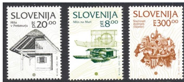
Slika 1. Znamke iz serije »Slovenija Evropa v malem« - prekmurska hiša, plavajoči mlin in dožnjek.