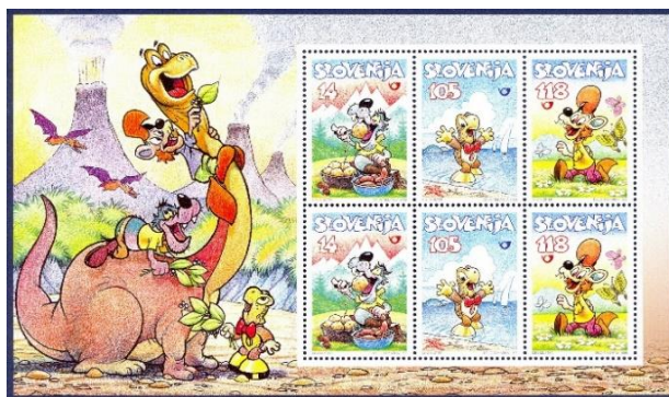
Slika 4. Blok z znamkami na katerih so Zvitorepec, Trdonja in Lakotnik.