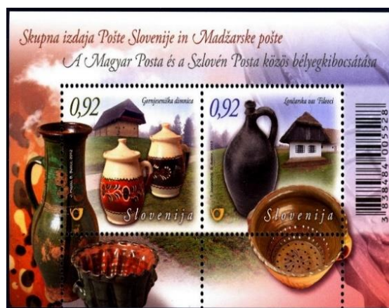
Slika 9. Blok skupne izdaje Pošte Slovenije in Madžarske pošte.

V Muzejski vasi Železne županije v Szombathelyu so obnovili slovensko dimnico iz Zgornjega Senika iz začetka 19. stoletja. Stene so iz lesenih brun, slemensko ostrejšje je izoblikovano na »škarišča« in pokrito s slamo. Hišo s črno kuhinjo so leta 1978 razstavili in ugotovili, da je bil stanovanjski del prvotno sestavljen iz dimnice, veže in kleti. V dimnici je bilo pet lin z giblivo desko, ena odprtina za zračenje in ena odprtina za odvajanje dima. Pri madžarskem tipu dimnice je imel vsak prostor poseben vhod iz odprtega hodnika. V skupni izdaji znamk sta Pošta Slovenije in Madžarska pošta izdali blok z dvema znamkama z nazivno vrednostjo za 0,92 evra v Sloveniji in 260 forintov na Madžarskem z motivom Lončarske vasi in Dimnice.