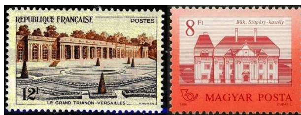
Slika 11. Veliki trianon v Versaillu in grad v Bük.