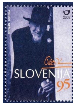
Slika 5. Znamka s portretom arhitekta Jožeta Plečnika.