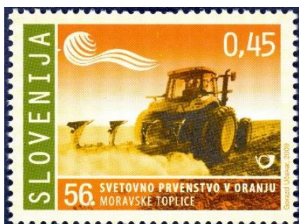
Slika 7. Znamka posvečena 56. svetovnemu prvenstvu v oranju.