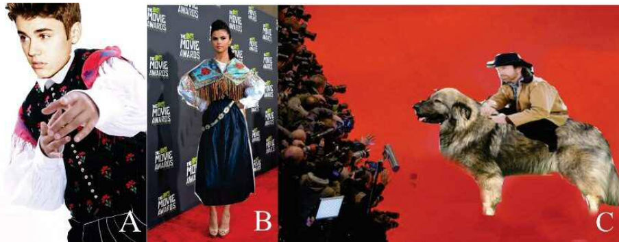
Slika 13: (A in B): Izdelki učencev, vezanih na slovensko narodno nošo; (C): Izdelek učenca

Fotografije obiskovalcev bi se samodejno projicirale na neko steno v galeriji. Projekcija bi se z dotokom novih fotografij ves čas spreminjala.