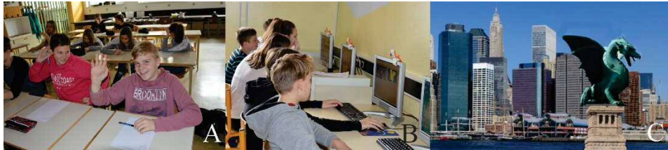
Slika 11: (A in B): Delo učencev; (C): Izdelek učenca 1

svet in ga narediti globalnega. Pred likovnoustvarjalnim delom so svoje ideje zapisali (slika 11A). S pomočjo svetovnega spleta so iskali fotografije in oblikovali fotomontaže. Učenci so razmišljali o postavitvi svojega dela v določeno okolje in o participaciji občinstva.