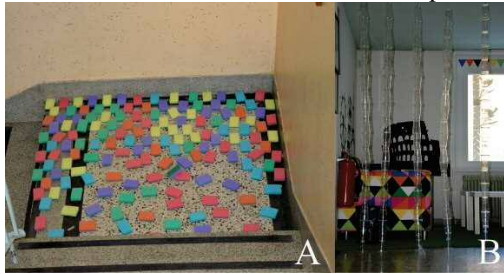
Slika 3: Izdelka učencev, vezana na prostor

Nastalo je 7 izdelkov. Učenci so povezovali vsakodnevni predmet v prostoru z neko smiselno povezavo. Dva izdelka učencev sta bila vezana na prostor (slika 3).