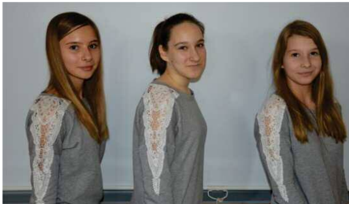
Slika 14: Spontano nastala ideja z naslovom Mi smo globalizacija ...

Slika 13C prikazuje fotomontažo, katere glavni motiv je kraški ovčar. Kot avtohtono slovensko pasmo ga je učenec 3 umestil na rdečo preprogo in ga soočil s paparaci. S tem je želel poudariti dvig popularnosti psa. Za humornost izdelka je poskrbel tako, da je poiskal fotografijo popularnega igralca, ki je »zajahal« psa. Na koncu izpostavljam delo, ki je nastalo po zaključku ure, ko so učenci že odhajali iz razreda. Eden izmed učencev je opazil dekleta, ki so imela oblečene enake majice. Predlagal je, da jih fotografiramo (slika 14).