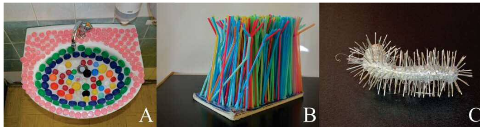
Slika 4: Izdelki učencev, vezani na predmete

Učenca, ki sta uporabila prozorne plastične lončke, sta želela narediti pregrado, ki bi ločevala šolski družabni kotiček od šolskega hodnika. S tem bi si učenci zagotovili intimni prostor, vendar se pojavi absurd v transparentnosti lončkov (slika 3B). Drugi predmet, vezan na prostor, je pomivalna gobica. Učenca sta pomivalne gobice postavila na stopnišče šole (slika 3A). Izpostavila sta nasprotje med gobicami, s katerimi dosežemo čistočo, in hodnikom, ki je zaradi prehajanja iz učilnice v učilnico izpostavljen umazaniji. Tudi pri tem delu sta učenca uspešno realizirala likovne pojme smer, gostota, ponavljanje. Po koncu dela sta želela spremljati reakcije mimoidočih, dogajanje pa sta posnela s kamero. Nekatera dela učencev so bila vezana na predmet. Izdelek, ki je nastal z velikim številom plastičnih pokrovčkov, prilepljenih na umivalnik (slika 4A), je izpostavljala nasprotje zamaška, ki zapira plastenko, iz katere vodo izpijemo, ter umivalnika in pipe, skozi katero vodo v plastenko nalijemo. Zamaški lahko pomenijo tudi oviro proti izlivu vode v umivalnik. Slamice, nalepljene na učbenik za fiziko (slika 4B), upravičujejo svojo funkcijo tako, da lahko z njihovo pomočjo »izpijemo« znanje iz učbenika. Zanimiva rešitev je bila kljuka, polepljena z žebli (slika 4C). Kljuka ne moremo prijati, če je oblepljena z žebli. Učenca, ki sta naredila izdelek, bi kljuko namestila na notranjo stran zbornice, da učitelji ne bi mogli k pouku. Ob delu smo zaznali prisotnost humorja.