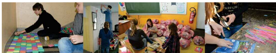
Slika 2: Ustvarjanje učencev z različnimi orodji in materialom

Demonstracija je potekala tako, da smo se najprej pogovorili o vsakem predmetu in o načinu, kako lahko spojimo različne materiale. Učenci so ustvarjalni proces začeli s snovanjem in oblikovanjem ideje. Želeli smo, da najprej oblikujejo svojo idejo, saj smo pri vseh nalogah želeli poudariti sodobni princip likovnega ustvarjanja – konceptualizem. Opazovanje učencev ob snovanju idej za likovni izdelek je razkrilo, da naloga terja od njih globlji premislek, kot so bili vajeni doslej. Pred zapisom idej si je večina učencev že izbrala material za delo. Svoje ideje so učenci začeli razvijati šele, ko so si izbrali vsakdanji predmet. Učencem smo ponudili možnost, da sodelujejo v dvojicah. Komunikacija v parih je stekla hitreje, pojavilo se je tudi več idej. Učenci so iskali nasprotja med izbranim predmetom in prostorom, kamor bi želeli multipliciran predmet umestiti. Po zapisu idej so se učenci dela lotili zelo zavzeto. Večina je z delom začela v razredu, dva para pa sta že od začetka delala na šolskem hodniku (slika 2).