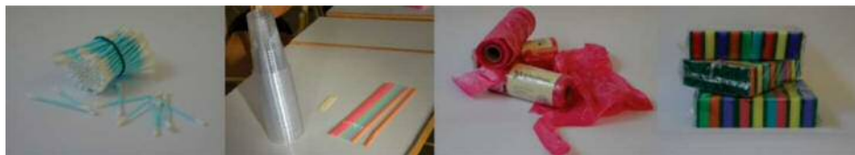
Slika 1: Material za likovnostvarjalno delo