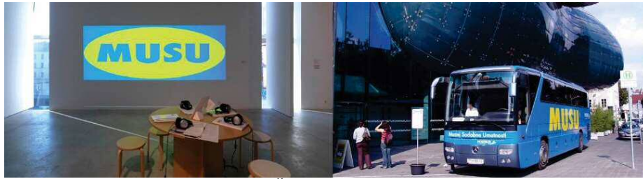
Slika 10: Apolonija Šušteršič in Bojana Kunst, MUSU

lahko izražamo skozi likovnostvarjalno idejo in likovnostvarjalno delo lahko povežemo z drugimi predmetnimi področji. Načrtovanje dejavnosti tretjega kroga smo nadgradili s cilji, ki smo jih poiskali v učnem načrtu za DDE, in v načrtovanje vključili učiteljico tega predmeta. Izvedla je uro DDE, pri kateri so z učenci obravnavali pojem demokracija, s poudarkom na globalizaciji (17. 2. 2016, 11.00–11.45). Za izpeljavo ure LUM smo načrtovali in izvedli 4 šolske ure: 4. 3. 2016 (10.10–11.45) in 10. 3. 2016 (10.10–11.45). Učenci so v tem koraku svoja razmišljanja in stališča o določeni temi izrazili s pomočjo likovnega materiala oziroma sodobnih medijev. Izpostavljen je bil koncept posameznika, oblikovan družbenokritično. Na začetku smo učencem predstavili idejo umetnice Apolonije Šušteršič in kustosinje Bojane Kunst z naslovom MUSU – Muzej sodobne umetnosti (slika 10).