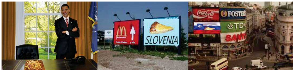
Slika 12: Izdelki učenek 1 in 2

Nastalo je 15 izdelkov, ki so bili vključeni v analizo. Ob vrednotenju izdelkov so učenci svoje ideje predstavili. Ob tem so morali opisati idejo, povedati, kako bi delo predstavili in na kakšen način bi v likovno delo vključili občinstvo. Z zadnjim so imeli učenci največ težav. Ob koncu so svoje izdelke natisnili in jih razstavili v razstavišču šole. V nadaljevanju predstavljamo nekaj najizvirnejših. Učenec 1 si je zamislil, da bi na mesto Kipa svobode v New Yorku postavil kip Ljubljanskega zmaja (slika 11C). Njegova ideja je bila, da bi na to mesto postavil še več slovenskih kipov. Fotomontaže bi razstavil v galeriji. Njegova druga ideja je bila, da bi s pomočjo ogledal v stilu iluzionistov na mesto originalnega kipa namestil npr. kip Prešerna in mimoidočim »v živo« predstavil naš kip. Učenec je navdušeno opravil nalogo, vendar v delo ni znal vključiti občinstva, ki bi le-to sooblikovalo.