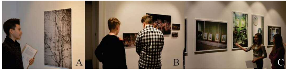
Slika 6: Samostojen ogled razstave

Po ogledu so učenci s kustosinjo pregledali izbrane izjave. Učenci so jih prebrali in jih komentirali. Lahko so podčrtali več izjav ali pa nobene, zato se število izjav ne ujema s številom učencev (preglednica 1).