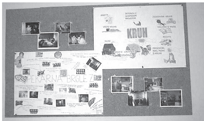
Slika 2: Plakati, nastali v okviru projektne učnega dela