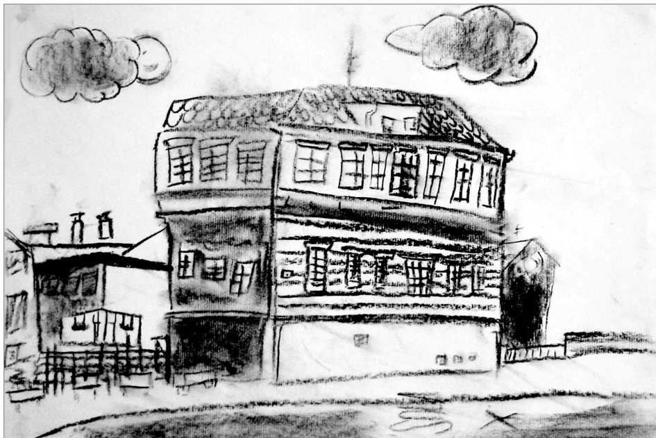
Slika 1: Deček A (9 let). Risba z ogljem.

ni likovni strukturi vidni impulzivnost in ekspresivnost v likovnem izrazu. Učenec je pri risanju uporabljal izjemno bogate in raznovrstne likovne ideje ter kombiniral tehnične postopke, ki mu jih je omogočalo izbrano risalo. To kaže na učenčeve dobre likovne izkušnje. Skladnost likovnega dela je dobra, ritmiziranje temnih in svetlih površin pa kaže na razvit likovni občutek. Nakazovanje prostora z uporabo različnih prostorskih ključev kaže na učenčeve izjemno razvite spacialne sposobnosti, odločnost potez pa pripomore k sugestivnosti likovnega izraza. Po analizi likovnega dela učenca lahko ugotovimo, da so na njegovem izdelku vidni mnogi znaki ustvarjalnosti in likovne nadarjenosti.