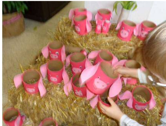
Bild 2: Das Glücksschwein, das Kinder unglücklich macht. Lorenz, 6 Jahre

Aus Zeit-, Platz und Geldmangel, aber auch aus Angst, dass Schüler/innen selbstständig vielleicht keine ansprechenden Bilder produzieren, lehren wir unsere Schüler/innen oft was möglichst einfach und leicht herzustellen ist und was von Erwachsenen als ansprechend, harmlos und dekorativ empfunden wird. Man könnte diese schnellen, produktorientierten Ergebnisse nach Gestaltungsvorlagen mit Erfolgsgarantie auch als Instant-Kunst bezeichnen. Sie besitzen keine persönliche, altersgemäße Handschrift. Nur mühevoll können Schüler/innen ihr eigenes Werk aus den vielen ähnlichen erkennen und entwickeln keinen Bezug zu ihrer eigenen Arbeit. (vgl. Pirstinger, 2016)