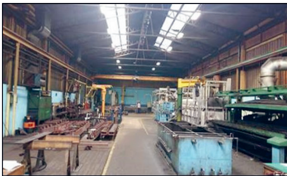
Slika 3: Obstoječa kalilna linija v podjetju: predgreвна peč, peč za avstenitizacijo, kalilni sistem

V nadaljevanju razvojnega dela smo pristopili k optimiranju procesa izdelave orodnega jekla, ki je sestavljen iz 3 sklopov (slika 3).