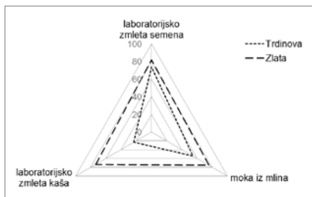
Slika 2: PrIMERJAVNA ODSTOTKA RAZBARVANJA DPPH RADIKALA Določeno spektrofotometrično v izdelkih obeh sort 'Trdinova' in 'Zlata' glede na način mletja

med antioksidativno vrednostjo moke iz mlina in kaše, medtem ko je pri navadni ajdi ta vrednost veliko večja, približno 31 % (tabela 1 in slika 2).