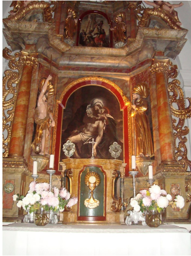
Slika 2. Podoba Žalostne Matere božje