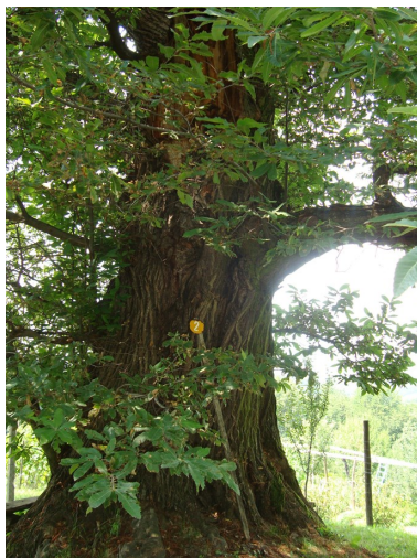
Slika 3. Označba energijske točke ob starem kostanju

Med obiskovalci Jeruzalema so različna razmišljanja o teh točkah. Določeni posamezniki jih razumejo kot izmišljotino, ki je nastala zaradi komercialnih namenov, drugi (npr. radiestezisti) so prepričan, da so ta mesta obstajala že prej in da so jih s postavitvijo količkov samo razkrili ljudem.